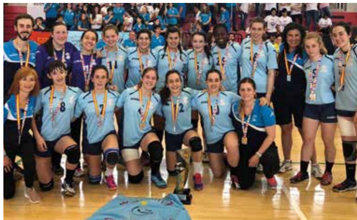
Malkaitz en el campeonato autonómico en Elda.

El trabajo que de un modo desinteresado se realiza en los diferentes clubes y deportes de Peralta, de un tiempo a esta parte, está dando sus frutos.