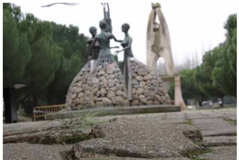
Parque de las Mujeres

Sin embargo, al final hay muchas decisiones que nos vienen impuestas desde el Gobierno de Navarra o el Gobierno Central y que, en algunos casos, nos han impedido hacer lo que realmente nosotros hubiésemos querido.